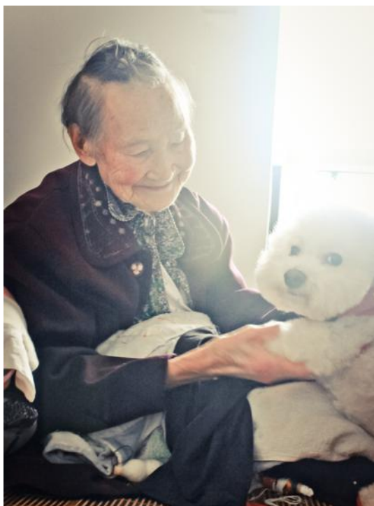
老奶奶特别喜欢丁丁

慈展会媒体报道链接： http://web.cncf.org.cn/content/2014-09/22/content_10184032.htm