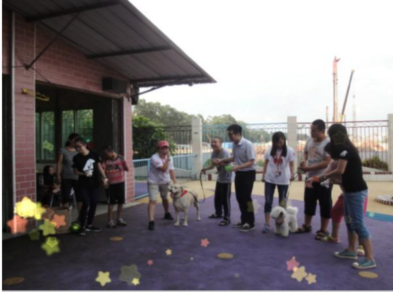
义工和孩子们在游戏

这个时候慧灵的老师以及义工们看出来“小不点”不知道如何与小狗接触，于是一直在旁边鼓励她，陪着她一步一步接近多宝。最后如大家所愿，“小不点”通过抚摸狗狗之后变得非常喜爱多宝！甚至最后大家离开时，“小不点”因为不舍而哭了起来。没有关系，“小不点”，我们下次还会再见的！