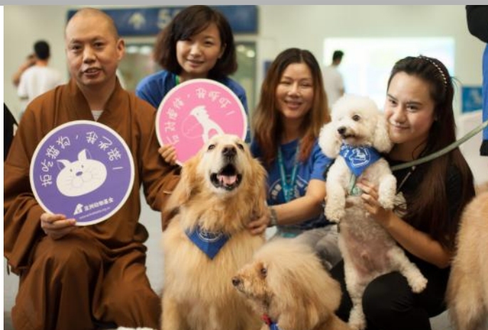
Q仔最后一次参加任务 和大家一起合照

另一位永远离开我们的小天使是来自成都的“狗医生”兔兔。在世界动物日当天，兔兔告别了爱它的主人去往另一个世界。兔兔2007年通过考试，是最早加入“狗医生”的成员之一。它的足迹踏遍成都的学校和养老院，深受探访对象的喜爱。兔兔原本是只流浪狗，被主人领养后为社会带来了正能量，也鼓励了很多想养狗的人以领养代替购买。感谢兔兔，我们不会忘记你。