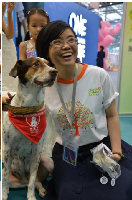
现在Lucy成了人见人爱的小明星

慈展会媒体报道链接： http://web.cncf.org.cn/content/2014-09/22/content_10184032.htm