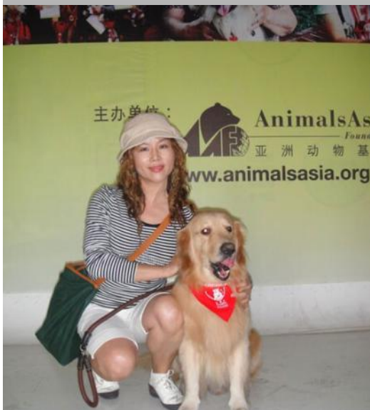
Q仔通过“狗医生”考试当日留影 我们还记得它兴奋的样子

在完成本届深圳慈展会的任务之后，来自深圳的“狗教授” Q仔因为患上重病，在三周后永远地离开了这个世界。9岁的Q仔在2009年10月第五期“狗医生”考试中脱颖而出，一直兢兢业业地为深圳的老人家和孩子们带去了欢笑。因为乖巧聪明，Q仔一直深受义工们的喜爱。我们感谢这位小天使多年来的无私奉献，希望它在天国好好安息。