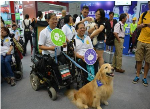
Q仔和来自香港的朋友们合影留念

残障人士坐在轮椅上，高兴地跟“狗教授”合影，还竖起大拇指夸奖。无论哪里狗狗都是最夺目的明星，还吸引了媒体跟着狗狗们拍摄。当走到大连导盲犬基地摊位的时候，导盲犬万福正好在现场。同行见同行，你是盲人的眼睛，我是老人的慰藉。大家都在帮助人类，那么，人类可以帮助到我们吗？