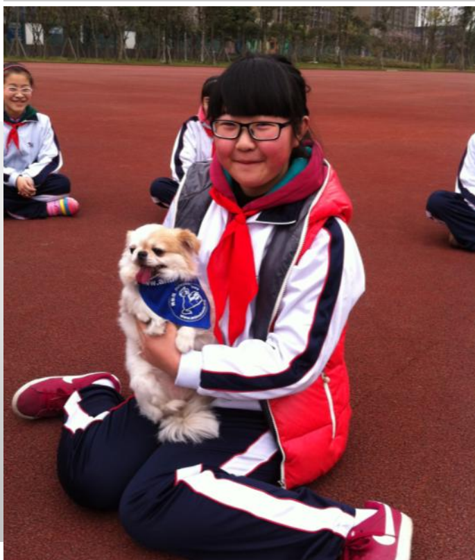
兔兔总能轻易“虏获人心”