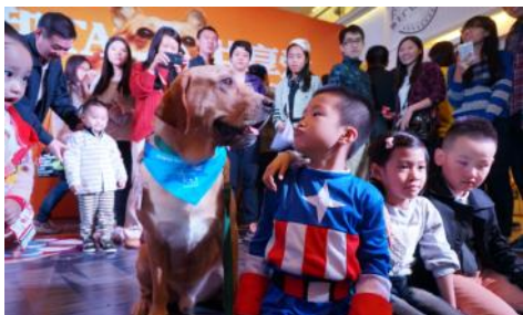
“狗教授”与孩子深情对望

2014年最后一个季度，深圳、广州和成都三地迎来了一年一度的“狗教授”嘉年华活动。我们在多个人气商场里举办的现场活动，吸引了大批孩子们与狗狗拍合照、玩游戏、做问答、看公益片、学习与猫狗相处知识，欢乐有益的亲子活动让大人小孩不亦乐乎。活动总计影响人次接近3万人。