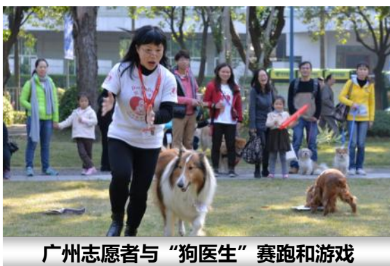
广州志愿者与“狗医生”赛跑和游戏