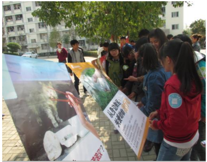
信阳大学的同学们正在阅读我们的海报

2014年亚洲动物基金向全国23个城市的动保机构、政府部门和合作单位寄送出宣传单张共计超过三万五千份，宣传海报超过一千张，光盘超过一百套。为全国各地超过30个公众教育活动提供免费宣传资料。