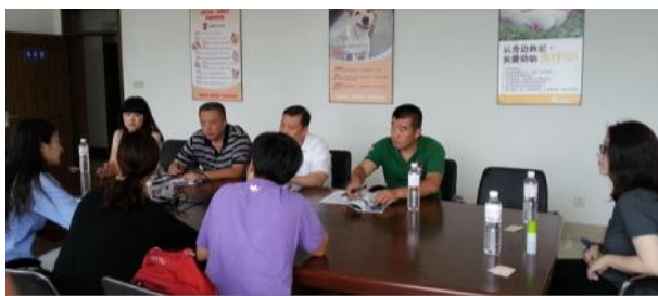
与青岛政府代表座谈

2014年，中国猫狗福利项目工作人员分别拜访了11个城市的养犬管理政府部门及当地动保组织，包括南宁、青岛、烟台、上海、澳门、珠海、南昌和长沙，以及我们在当地有办公室的广州、深圳和成都，与他们面谈交流及参观他们的动物收容所等。在走访过程中，我们与青岛市人民政府代表、澳门民政总署代表等政府官员展开了座谈，切实了解当地政府在养犬管理工作上的做法和难题，提出了我们的建议和意见，同时借鉴了一些优秀的管理方法用以推荐给其他城市学习。走访当地动保团体过程中也了解到他们所遇到的困难，并提供了一些可供参考的建议。