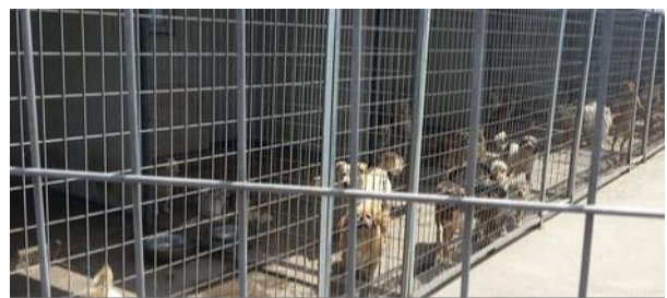
烟台流浪动物救助站犬舍