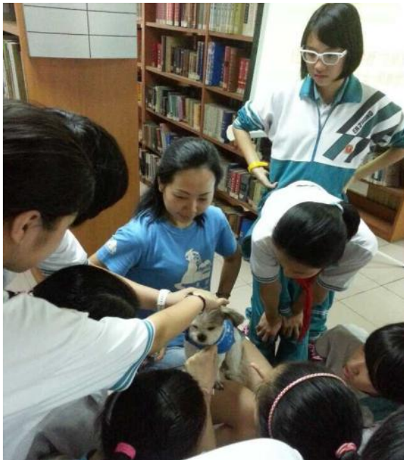
可爱的“狗教授”妹妹吸引了一大帮小粉丝