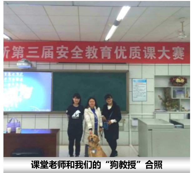
课堂老师和我们的“狗教授”合照