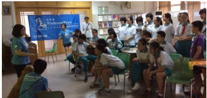
同学们认真听“狗教授”主人讲故事

5月30日，“狗教授”巴迪和妹妹受邀来到广州市第二中学图书馆参加“真人图书”分享会。同学们在“狗教授”互动课堂中与狗狗的主人交谈，“翻阅”他们的故事，感受着两只狗狗从弃犬到成为“义工”的经历，慢慢认识和了解这些四条腿的好朋友和好帮手。