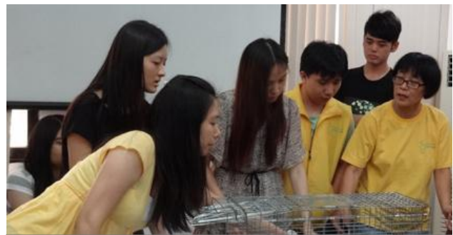
学员们在学习使用捕猫笼的技巧

由亚洲动物基金资助，北京幸运土猫团队主讲的流浪猫绝育放归计划（TNR）深度培训分别于2014年6月和8月为南宁、上海和杭州共5个团体开课。讲师向大家分享了TNR实操经验，当地义工们也分享了流浪猫救助还有团队自身发展的情况，双方还就下一步TNR项目的实施进行了有效的探讨。培训同时，我们还为参加的团体资助了猫粮、抓捕笼、运猫袋等工具，以便于团体后续的项目工作开展。