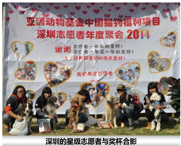
深圳的星级志愿者与奖杯合影