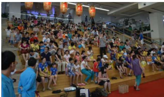
嘉宾们给大家讲解文明养犬知识