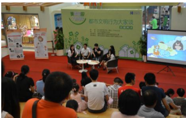
现场观众参与讨论

7月27号下午亚洲动物基金受邀参加由深圳市福田区文明办主办的“都市文明行为大家谈”系列节目之“文明养犬”活动，就文明养犬中的一些常见问题进行探讨。座谈会现场还播放了我们最新制作的《与猫狗相处知识学堂》视频，给公众普及文明养犬以及犬只护理知识。