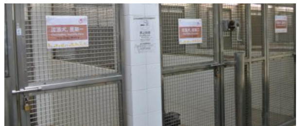
澳门市政狗房一角