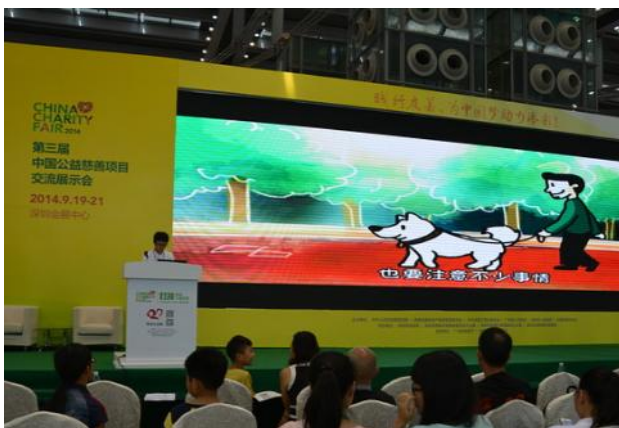
短片在慈展会现场播放

9月19日到21日亚洲动物基金参加了在深圳由民政部主办的第三届中国公益慈善项目交流展示会。在慈展会现场，我们除了在摊位向大家以派发宣传资料、举办讲座和播放视频短片的方式展示亚洲动物基金猫狗福利项目的工作内容和传播猫狗福利知识，还安排了几位“狗教授”来到现场与大家亲密互动。让民众更深刻地体会到狗狗作为人类好朋友和好帮手的魅力。