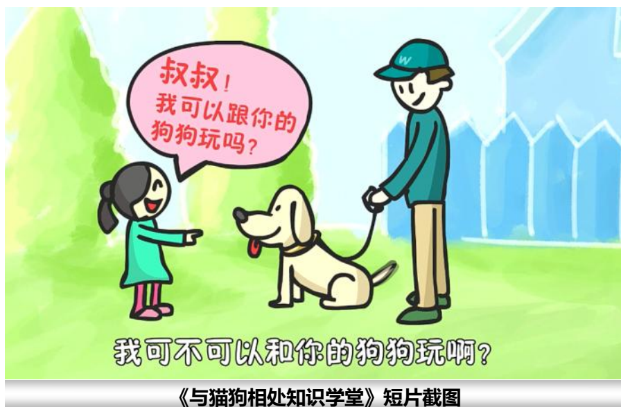
《与猫狗相处知识学堂》短片截图