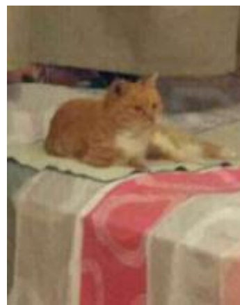
2号猫咪在领养家庭中