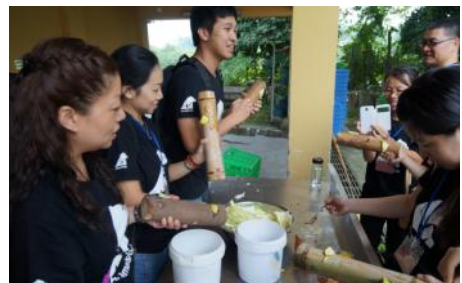
义工们给黑熊制作丰容器具