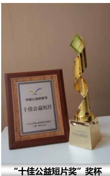
“十佳公益短片奖”奖杯

《与猫狗相处知识学堂》视频在试播期间，得到了社会各界的认可和众多教育工作者的赞誉和推荐。在深圳慈展会上该视频更获得首个国家级公益影像节——Vcare中国公益映像节的“十佳公益短片”殊荣。接下来，我们将会把该视频片推广到全国各地的中小学校进行播放，向孩子们普及关爱动物及文明养犬、做负责任主人等生活常识，从小培养他们的爱心和责任心。