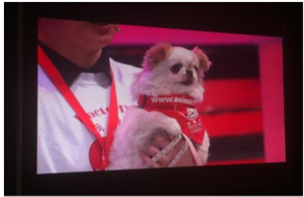
兔兔在摄影机前表现淡定

希望通过节目传播给大家的正能量。现场录制完后，华西证券公司还为我们“狗医生”项目捐赠了3200元人民币！感谢该公司对公益活动的慷慨支持。