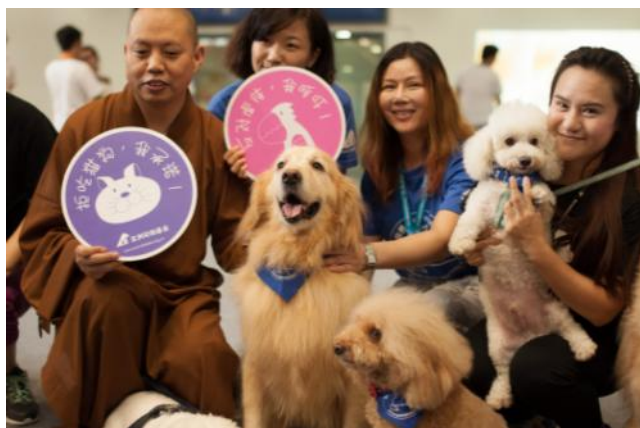
“狗教授”们在慈展会现场受到大家喜爱