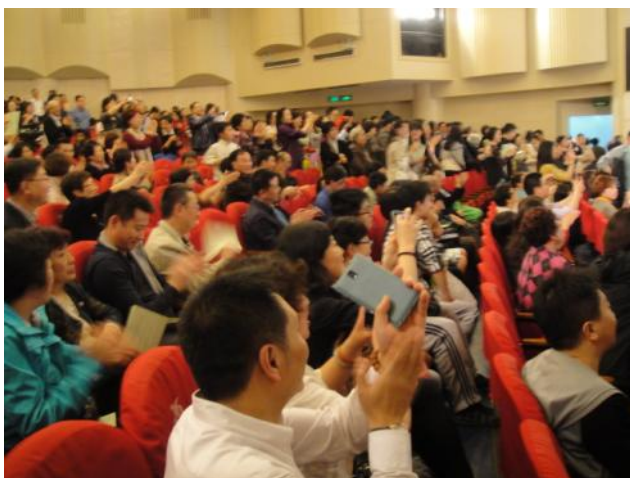
义演现场观众反应热烈