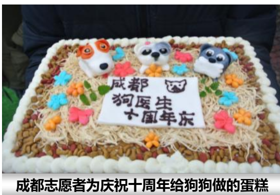
成都志愿者为庆祝十周年给狗狗做的蛋糕

2014年是亚洲动物基金猫狗福利项目在中国大陆正式开展工作的10周年。今年我们首次设立了“猫狗福利志愿者之星”大奖，用于奖励在亚洲动物基金服务多年的优秀义工。在一年一度的义工聚会上，11位广州、深圳和成都的优秀义工及“狗医生”获得了这个特别嘉许，感谢他们多年来出色的工作以及无私奉献的精神！