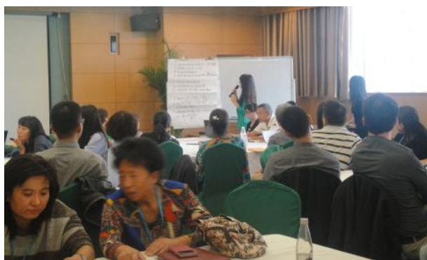
动保团体代表在进行分组讨论