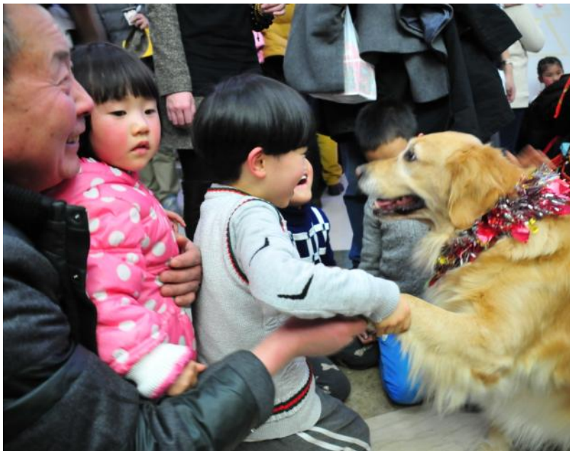
小朋友排队跟狗狗互动