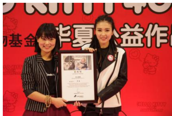
我们赠与毕夏感谢证书