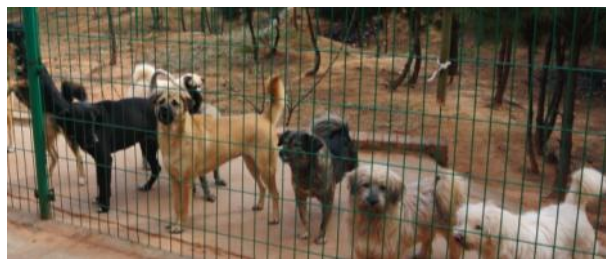
南昌小动物保护协会犬舍