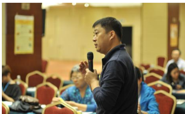
山东济南赵大队在向发言嘉宾提问