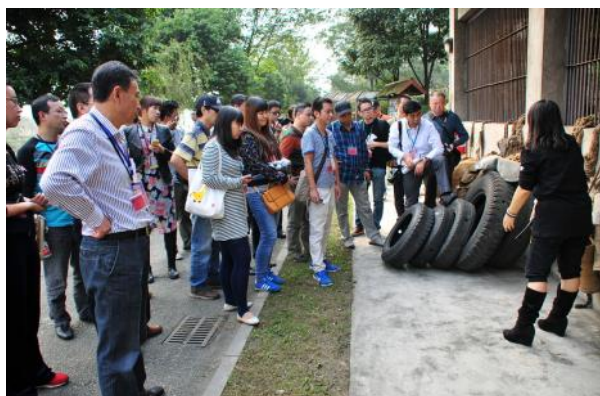
与会代表参观龙桥黑熊救护中心