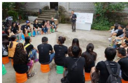
我们的工作人员在介绍部门工作

中，除了有团队建设活动外，大家还参观了四川龙桥黑熊救护中心，为黑熊制作了丰容物品。活动让我们的义工和支持者们对亚洲动物基金的工作有了进一步的认识。