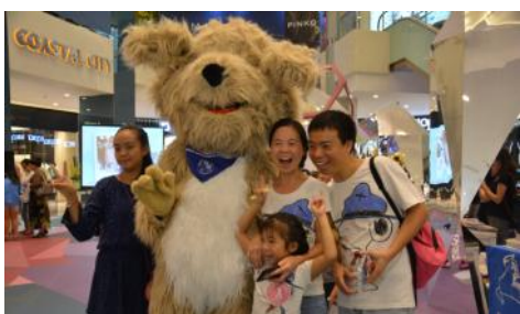
Eddie人偶受到大家喜爱