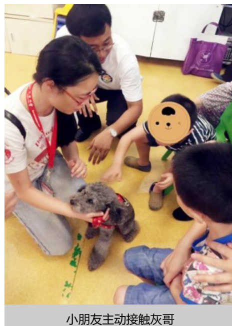
小朋友主动接触灰哥

憨憨一脸的天真表情引得孩子和家长们忍俊不禁。高颜值的帅哥灰哥，任大家怎么摸他都一副享受的表情。阿波罗则更“悠闲”，直接躺在地板上任大家按摩。有个孩子本来有点害怕大狗，刚开始时一摸就马上把手伸回去，但是等阿波罗躺在地板上之后这个孩子干脆整个人都趴了上去，旁边的家长看到平常不多话的孩子这么主动去跟外界接触，都非常感动。