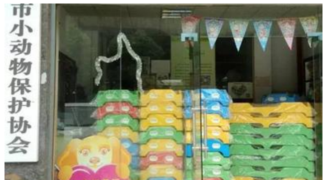
100张新狗床运到协会办公室