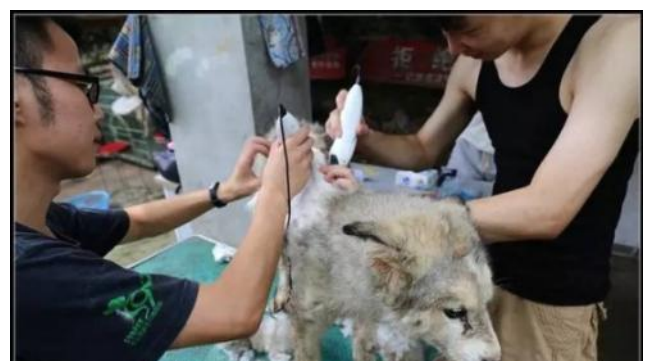
志愿者为狗狗剃毛