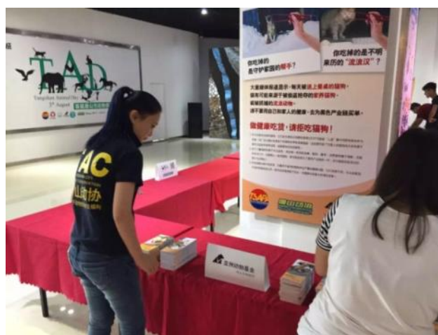
唐山领养日现场 亚洲动物基金的海报