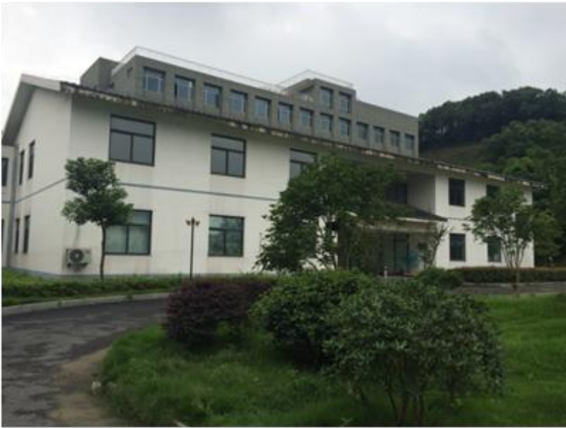
杭州市犬类收容中心环境