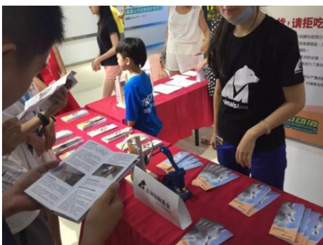
唐山领养日现场 民众阅览亚洲动物基金宣传册