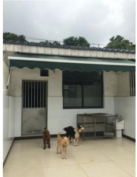
杭州市犬类收容中心犬舍一角