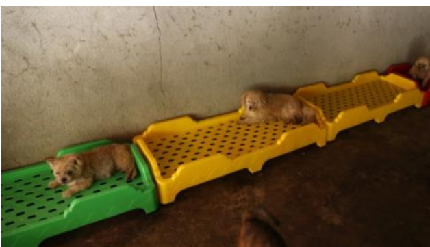
新的塑料狗床到位 透气易清洁