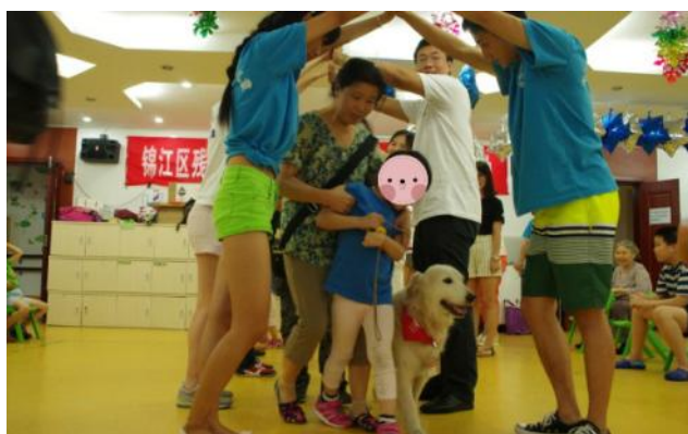
小朋友带着狗狗“钻山洞”

biz=MzIwMTM5NDA2OA==&mid=207235246&idx=1&sn=0a63ee9ab2351ff4ba13edb3a17e4d53&from=singlemessage&isappinstalled=0#rd