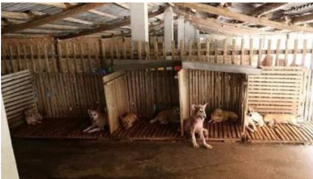
中心的旧木质狗床 潮湿并易滋生细菌

在走访并了解困难后，6月我们为武汉市小动物救助中心捐赠了10个剃毛器、100张塑料床，以帮助中心300只犬只，希望狗狗们安睡的环境更加清洁干爽。7月，物资已经全部到位。由反馈的照片可见，狗狗们已经睡上了新的床。新的狗床将更透气以及易于清洁。而剃毛器的到来也解决了狗狗炎热不适的问题。