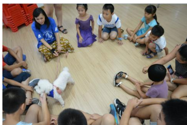
小朋友围城圈跟狗狗接触