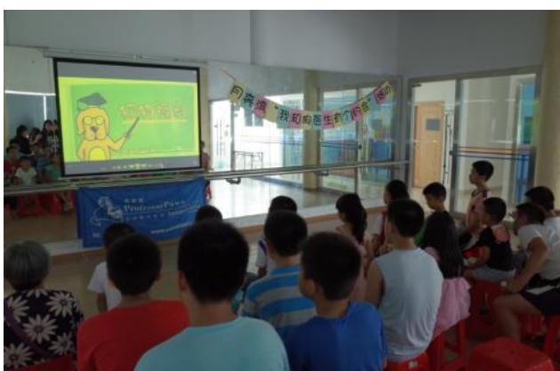
孩子们在认真观看“与猫狗相处知识学堂”

奥一网报道： http://epaper.oceee.com/epaper/H/html/2015-07/31/content_3451306.htm?div=-1