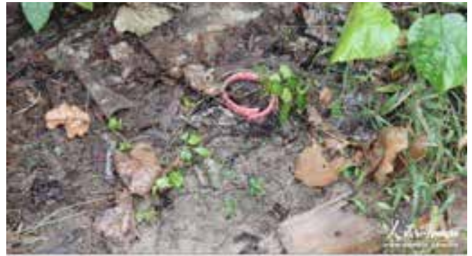
被摘下扔掉的宠物猫项圈。