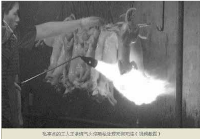
私宰点的工人正拿煤气火焰喷枪处理死狗死猪(视频截图)

第一个档主热情地向记者推销:“靓狗肉,每斤卖五块八,够便宜了。”记者借口货比三家,旁边另一个摊档老板听见便悄声告诉记者:“好狗肉就算是批发,每斤都要卖九块十块。一分钱一分货,不可能五块多就能买到好货……”正说话间,记者留意到一名男子向第一个档主采购了一批狗肉,然后迅速将货物送上一辆车牌为“粤E5A673”的小面包车。可能因为心虚,他还故意用布将尾部的车牌遮挡住。