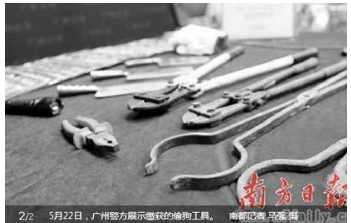
2/2 5月22日,广州警方展示缴获的偷狗工具。

用铁丝自制的套索或1米多长的大铁钳。作案时,团伙成员站在车门处,将作案工具伸出车外套住犬只颈部,然后借助车辆加速顺势将犬只强拉上车,整个过程不超过5秒钟。