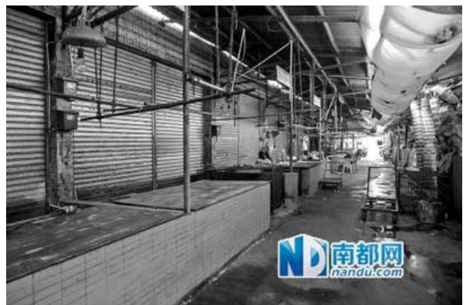
昔日的“狗肉一条街”终于被整顿“清理”。

此前亦多次执法,为何此次才最终清理?容桂市监分局相关负责人介绍,主要原因是去年4月,农业部下发通知,要求猫和犬必须逐一检疫开证,即逐一出具狂犬病抗体证明以及省动物卫生监督机构指定的有资质的实验室出具的其他疫病报告。这即是俗称“一犬一证”政策。该政策出台后,只要每只犬不能提供相关检疫证明,就得停止销售。“这是执法的明确依据,经过我们前期摸底、调查,许多售卖狗只并不能提供一犬一证,所以要清理。”