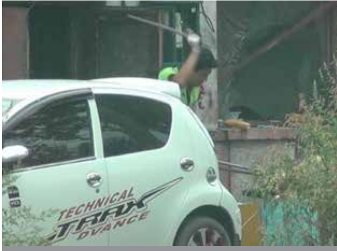
图37:犬只被逐只用铁钳夹住颈部从笼具里拖出 图38:随后工作人员用棍子猛击犬只头部打晕犬只，再送进里屋的屠宰间

犬只被屠宰后皮卡车又将这些狗肉运往了“群众砂锅狗肉鲜”餐馆，我们继续一路追踪这辆车来到餐馆。车主在皮卡卸货之后，就马上离开了。接着调查员进入餐厅并伪装成食客叫了一些没有狗肉的菜品，希望能有机会和饭店老板攀谈。调查员问到犬只的来源，服务员告诉我们是从小村农家收购后自己养着需要时再自己屠宰，保证健康安全。这个说法明显跟我们看到的事实不符。她还介绍说餐馆每天会消耗10只狗左右，她从小就在这家餐馆吃饭，馆子经营了20多年了，以狗肉为主，而且生意很好，饭点的时候基本上客满。最后结账的时候，我们再次叫来老板询问犬只的来源。老板还是说犬只是从农村收购后，自己杀的。