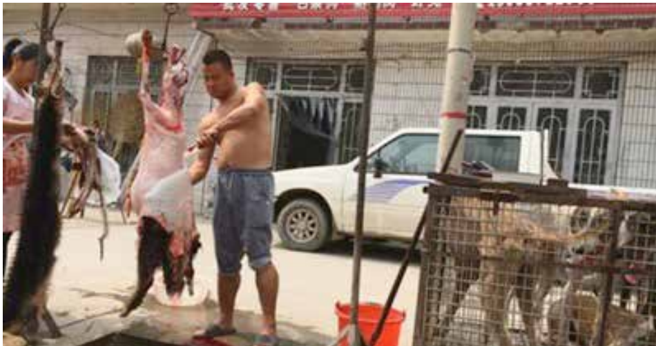
图42: 犬只在被剥皮的时候还未完全死亡, 不时抽搐抖动

铁笼中供客人点杀的犬只中有灵缇、混种藏獒犬等名种狗以及土狗, 犬种不一显然并非集中专业养殖的肉狗。随意在街边进行的犬只宰杀, 也让路人和我们都触目惊心。我们不难发现: