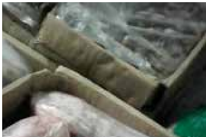
图47-48:问题狗肉上打着检疫合格标志

在南极市场,我们发现部分被宰杀后的犬只被贴上了“动物产品检疫合格证”的标签,看似非常正规。但深入了解时,部分店主却向我们透露现有的狗肉分为注水和不注水两种,水少的价格就会高一些,同时,在问及犬只来源时,大部分店主也说他们的狗只都是收购而来的。众所周知,“检疫合格证”是普通市民鉴别合格食物的标准,披着合格的外衣却有着不确定的安全风险,市民的食品安全究竟应该怎样保证?