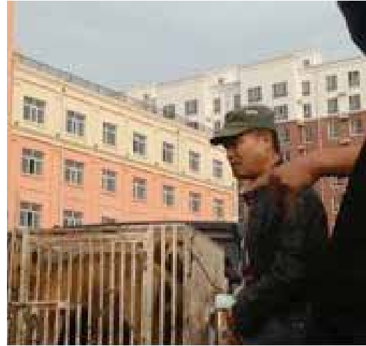
图21:另一只被买下的德国牧羊犬; 图22:收狗人