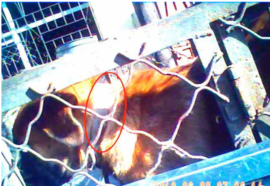
图23:2012年到访时,刚好有一批犬只运抵,我们看到其中有两只狗都佩戴了项圈

亚洲动物基金2次走访过这家犬只屠宰场所,一直以来看到的屠宰情况都很差:屠宰场内部环境恶劣、恶臭扑鼻、满地粪便、犬只健康状况堪忧,屠宰方式残忍,其他待杀的动物常常都在哀嚎和颤抖中目睹同伴的惨死。屠宰场门口及室内都装有摄像头,可见此行业人士的高度谨慎。