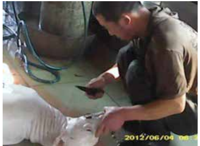
图25:屠宰前没有任何的检疫,操作人员甚至一边抽烟一边操作,整个操作环境另人作呕;图26:工作人员在满地的污血中进一步处理犬只的尸体

关于检疫的问题,老板说:“检疫证“可以整”,每天只要有狗来,就会打电话给检疫的人让他们过来看,所以没问题,如果不检疫会被罚款。“但是,在2次走访中,在屠宰整个过程中我们都没有看到有任何的检疫人员或者检疫的过程,屠宰都是在脏乱的环境中进行。同时,我们还了解到为了追求高的利润,工作人员还会根据部分客户要求对犬只进行注水。