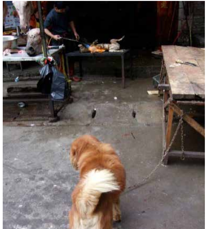
图45-46:老板的宠物犬被迫注视着已经死亡的同类被褪毛的过程

在市场内的另一家店铺我们发现了一只被捆绑四肢在铁架上的犬只正在被褪毛,店铺一旁拴着老板的宠物犬,它注视着同类被褪毛的画面。我们上前与老板攀谈,他一开始对我们宣称这是一只狐狸,过后又随即承认其实是犬只。而近距离观察这只犬只时,我们并没有在其头部、颈部和躯体上看到伤痕,这让我们怀疑它是被毒杀至死或病死的。