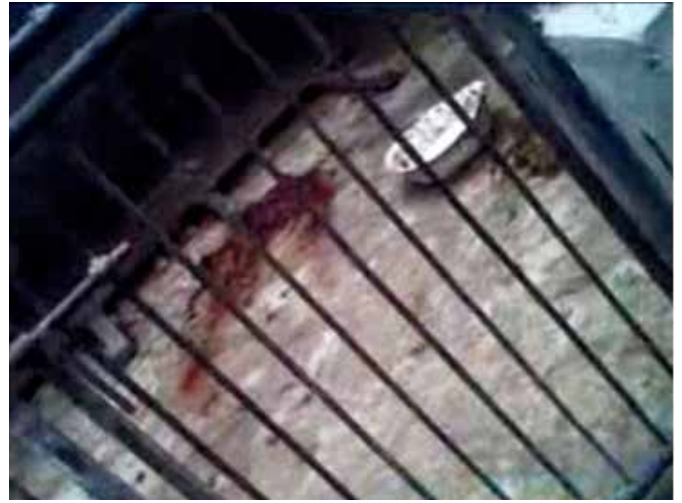
图31: 2012年暗访, 犬舍中犬种不一, 这条拉布拉多眼角有明显分泌物, 疑似患有犬瘟热; 图32: 很多犬舍里面都有死亡的犬只, 尸体已经腐烂

2014年我们再次到达时, 据对方工作人员介绍今年的生意不如去年的好, 现在每天能杀100多条, 去年能杀200多条。动保团队的拦车救狗事件让货源减少, 而且狗肉的价格也更高, 每斤涨了两块钱左右。由于现在运狗车还需要安排其它车辆护送, 增加了成本, 这也是狗肉涨价的原因之一。现在每个月的销量大概在一万吨左右, 他们以做生鲜为主。他们这边的厂里有30多名员工, 一般早上5点开始宰杀, 在河南也有个屠宰场,。在2012年我们来调查时下午三点这里仍在宰狗, 而2014年这次调查现在还是上午, 工场已经没有在开工的迹象了。