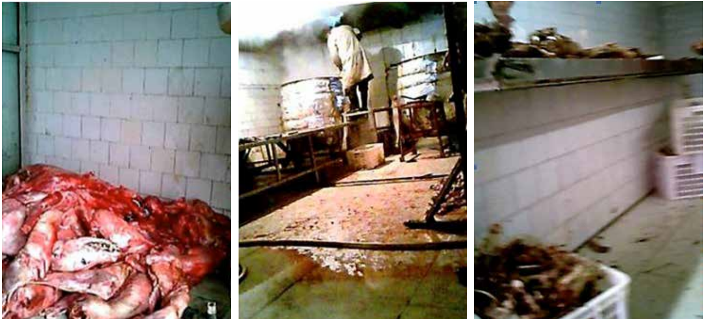
图59: 屠宰后的犬只被随意堆积在肮脏的地面; 图60: 操作间可以随意进出无需任何卫生防护或消毒措施; 图61: 地面四处可见犬只内脏、残肢

2011年我们首次到访时, 生意十分红火, 工场的车间地板上堆着大量屠宰后的死狗尸体, 屠宰, 分割, 卤制等工作开展的如火如荼。但同时我们也注意到这里宰杀后的狗只被随意的丢弃在肮脏的地上, 臭气熏天, 地上到处都是毛发、狗只的内脏等, 环境十分肮脏, 卫生条件令人担忧。同时, 我们全程没有看到任何的检疫人员或相关检疫工作开展。