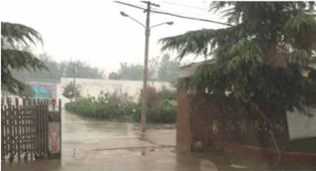
图58: 诺大的工厂里空无一人

据汉刘邦公司网站信息介绍: 汉刘邦成立于一九九五年, 是一家专业从事开发生肉制品的企业。主要产品有软包装狗肉、驴肉、冷冻白条狗、白条鸡、鸭、牛肉等系列产品。公司占地面积八千平方米, 有员工120余人, 年产值2000万元。