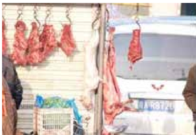
图49-50:2012年走访时,每间狗肉铺的生意都非常红火