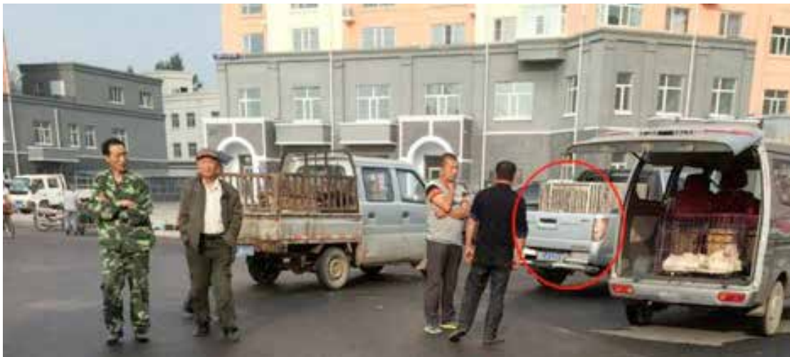
图18:红圈内为收狗的皮卡车尾部,左边的车辆是送狗的卖家,右边是另一车辆卖宠物狗的小贩

下图中的皮卡车从路边的小贩(甚至也有普通市民)手中买下犬只,这些犬只品种不一,有的十分虚弱表现出明显的患病特征。经过简单的讨价还价,这名狗贩买下一只生病的土狗(600元)、一只德牧(700元)和一只金毛犬(860元)。在收购了十多只狗后送到当地的一家屠宰场进行屠宰(永祥屠宰场),屠宰后又送到一家餐厅(群众砂锅狗肉鲜),本报告后文中会讲到在这家餐馆内老板向我们提供了明显与事实不符的狗只来源信息。