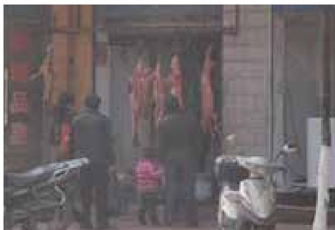
图51-52:2014年再次走访时,集市里的狗肉铺已经关闭,集市外仅剩一家,且规模缩小了很多