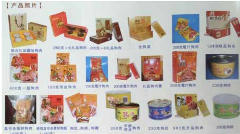
图4:樊哙狗肉制品有限公司的介绍资料上显示其产品多达24种

除去专门的犬只繁育场/养殖场,也有狗肉食品公司一直对外宣称他们有自己的养殖场作为货源。为此我们来到了沛县最富盛名的一家企业——樊哙狗肉制品公司,这家企业历来对公众和媒体宣称他的肉狗均来自自己的养殖场,樊哙是一个“集肉狗养殖、狗肉加工、狗肉餐饮于一体的产业化龙头企业” 6 。我们曾于2011年及2014年两次到访该企业。