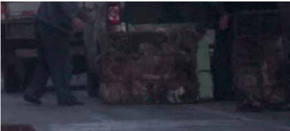
图56-57:我们在其中一天拍摄到的活狗送货场面,每只铁笼里拥挤地塞满犬只,早上不到5点街道的宁静已经被犬只的惨叫声打破。