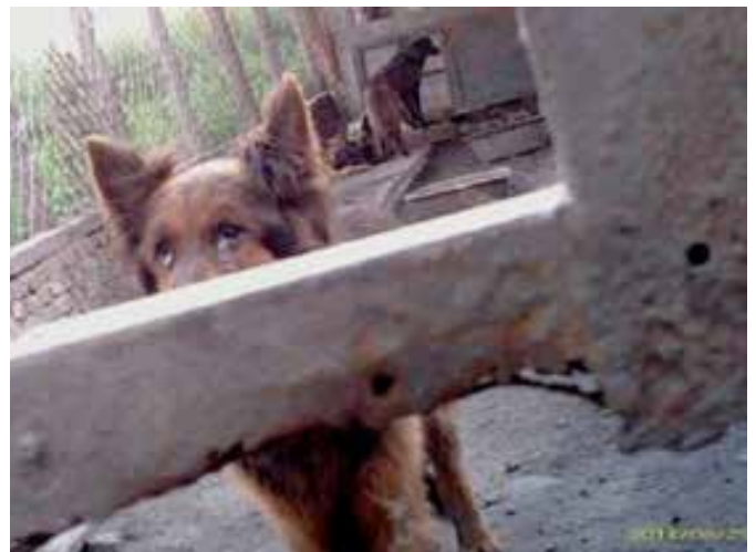
图35:这家屠宰场工作人员都十分警惕,门口也装有摄像头,但是外来人员进入时却不需要经过任何的消毒程序。