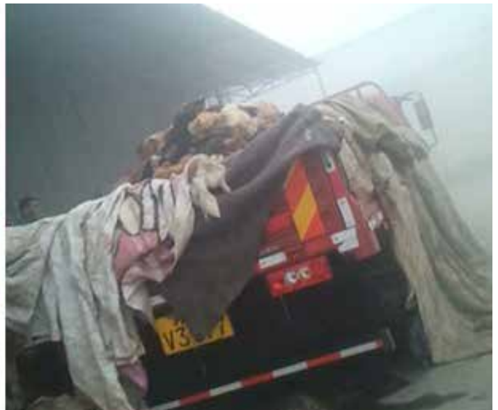
图5:2013年,沛县德邦物流站内的冻库门口,正在卸载死狗;图6:送货的卡车上满载带毛的死狗,运输途中车辆用帆布、棉絮等物覆盖