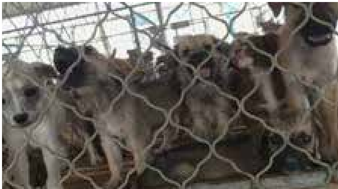
图2:嘉祥县一家繁育场内的犬苗(即幼犬)犬舍;图3:在一家声称大规模繁育场里我们实际上只看到少量的犬苗。

其中一家万达肉狗繁育场相对来说规模较大,据介绍其经营模式是:养殖场提供“狗苗”(而产崽的母狗也是来自周围农户,并没有在养殖场,养殖场只有少量种犬做展示用),狗苗全部下放到周围的农户去散养至出栏,然后农户可以选择让养殖场回购成犬或者直接自己出售。我们在这里只看到了20-30只成犬及约数百只犬苗(幼犬)。