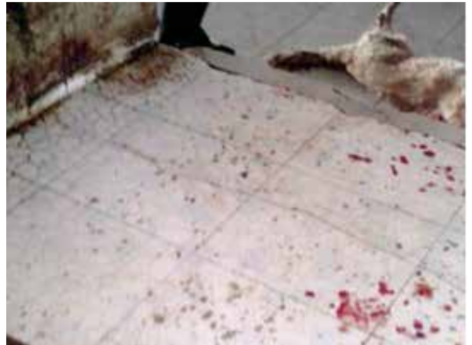
图33: 被选中点杀的金毛被屠夫硬拖出犬舍; 图34: 屠宰方式也是棍棒击晕, 然后脱毛、分割, 屠宰间的环境十分肮脏, 满地污血和污物