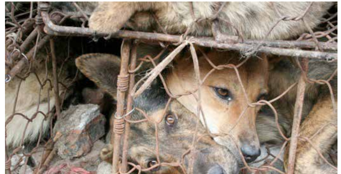
图10: 运输车辆锈迹斑斑, 布满毛发和脓血层层叠叠的堆积着大量铁笼; 图11: 犬只被拥挤的关在一起, 长时间忍受着饥饿和缺水

囤积中转点的狗只到达一定数量后, 囤积点就会安排大货车将狗只统一运输到外地。作为肉食性动物的狗只因反抗性很强, 这让它们在被抓捕、运输、屠宰的整个过程中都不可避免地遭受着大量的暴力对待, 饱受折磨。在我们的调查中看到, 这些狗只被粗暴地抓捕、被强行塞入狭窄的铁笼, 尾巴和脚被夹断, 没吃没喝, 怀孕的狗只在长途运输中生产。被转运的犬只被严重挤压, 动物福利无从谈起。很多犬只带有明显病征, 每次转运, 均有狗儿因疾病或者严重挤压死亡, 也有犬只在拥挤的环境中相互打斗受伤, 而这种环境无疑更促进了疾病的传播。运输的车辆几乎都是装载满满一车狭小的铁笼, 常常每车都载有几百只狗, 到达目的地后铁笼被直接从车上抛下。