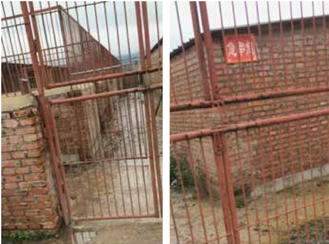
图27-28: 数百间的犬舍空空荡荡, 现有的犬只不到10只