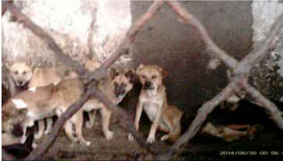
图24:犬只囤积房间,环境十分恶劣,毛发、粪便四处都是,犬只的健康状况很差,少有站起来活动的

在2014年我们再次到访时,发现和2012年相比该屠宰场经营的衰败景象十分明显,整个规模缩减了,开工频率也大不如前,对方还告诉我们货源紧缺和需求量的减少让他们自己也不确定这个行业未来会如何发展。