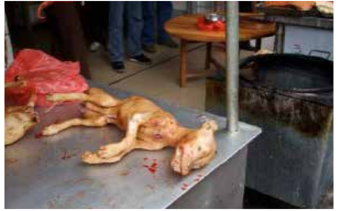
图43-44:市场上出售的犬只体积都较小,不似养殖场培育出来的肉狗的体积

在洞口市场我们毫不意外的看到鳞次栉比的狗肉摊档,大量陈列在案头的犬只尸体却是小型犬,对此我们不禁再一次质疑犬只的来源。如果它们真的是源自养殖场培育的肉狗品种,那么犬只的尸体绝不是这样的体积,这些小型犬很有可能是来自普通人家的家养犬只。