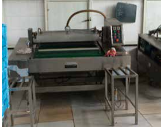
图62-63: 车间里布满了厚厚的灰尘, 空无一人, 显然已经停工一段时间了

2011年,我们首次走访汉成堂的时候,发现这家企业的规模在我们所调查的狗肉制品企业里是最大的。但在2014年我们再次到访时,我们发现厂区空无一人,车间里的情况跟汉刘邦相差无几,干净,没有明显异味并且布满灰尘。第二天,当我们再次来到这里,在办公楼里找到了几位行政人员,据其中一男工作人员介绍说现在这个行业检查很严,包括冻车也会被查,没有货来生产,他们就没有开工,在这里的其它好多家企业也停工了。同时,在交谈中,他也再次提到,根本没有肉狗的养殖场,狗都是一家家收来的。