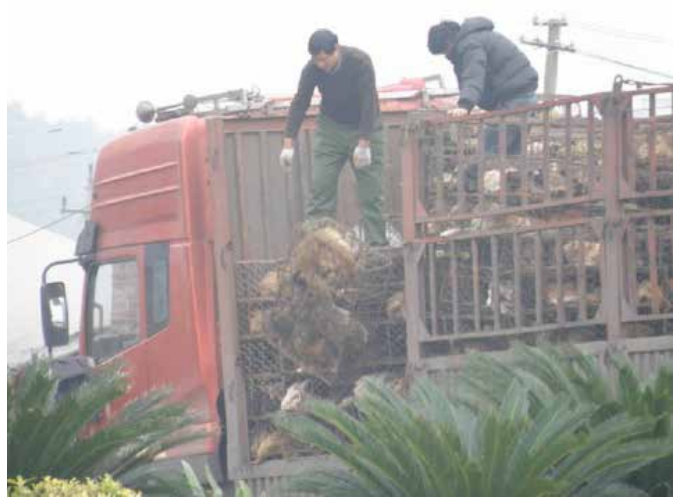
图12:几百只狗拥挤地关在狭窄的铁笼中; 图13:犬只被关在铁笼中从高高的卡车上抛下。

在雷南大道的一家犬屠宰场旁我们拍下了运狗车到达和卸货的完整过程。超大的卡车上密密麻麻布满了铁笼,里面关着数百只犬只。铁笼被从几米高的车顶直接扔下,下面只用一个旧汽车轮胎做缓冲,现场一片犬只的惨叫声。随后这些犬只大部分被送往旁边的一家屠宰场进行屠宰,有少部分则被驾驶摩托车的小贩收走。同样,所有的过程没有检疫及卫生手续的交接。