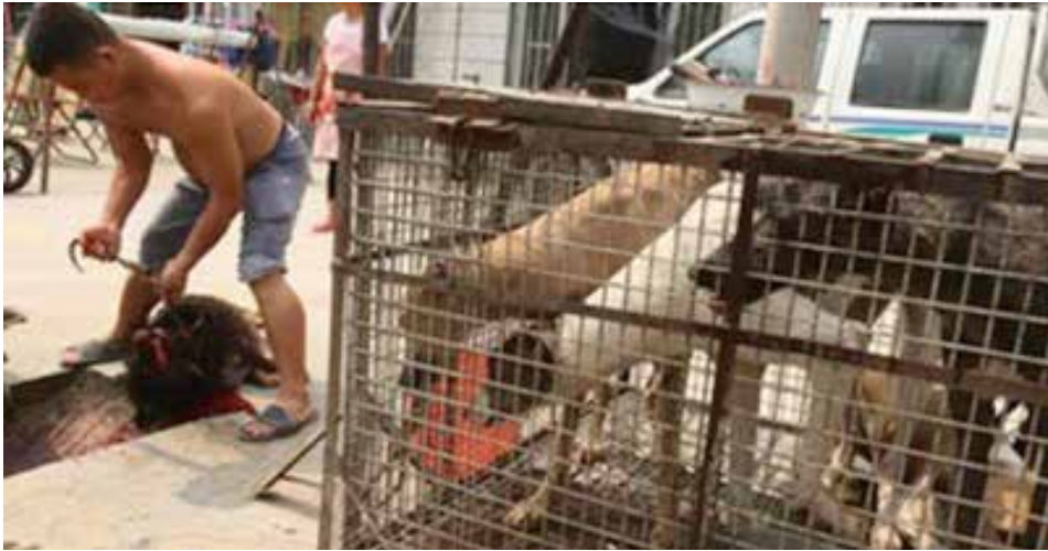
图41: 餐厅老板当街就开始屠杀一只混种藏獒犬, 将犬只打晕后割喉放血, 立即引来大批苍蝇, 一旁铁笼中的犬只紧张地注视着同伴被宰杀的过程