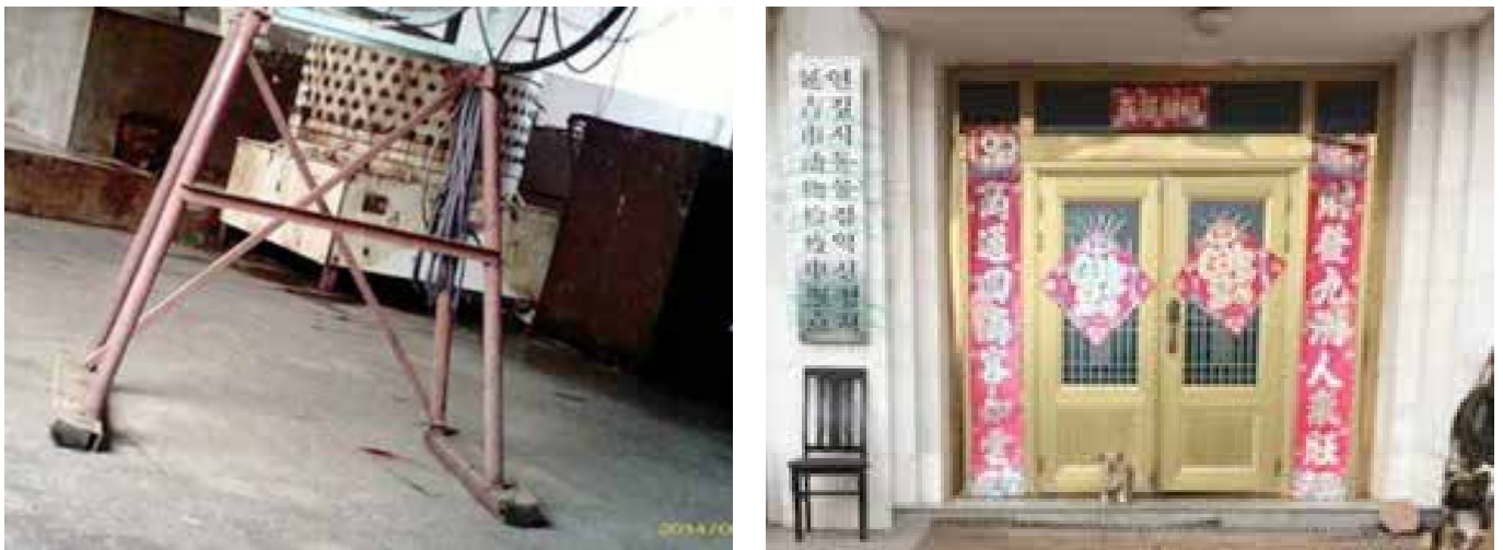
图29: 屠宰间里空无一人, 看上去已经停工一段时间; 图30: 屠宰场设有政府的动物检疫申报点, 但并没有工作人员在值班

根据之前《苹果日报》一则名为《吉林省延边申联食品厂推出的“狗肉方便面”惊销全国》 20 的新闻介绍, 这里的惠民屠宰场是延吉市规模最大的一家屠宰场, 该屠宰场从河南、湖北、湖南等地大量进货, 除了狗肉食品公司以外他们也向当地的市场和超市供货。屠宰场的老板本来是一名从业二十多年的屠夫, 他干这行积累了大量资金后投资开了这家屠宰场。