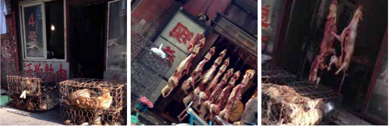
图53:拥挤不堪的铁笼中装着可供点杀的活体犬只;图54:一家店已经悬挂出一排宰杀好的犬只尸体;图55:在另一家店等待点杀的犬只上方同样悬挂着同伴的尸体

西塔是朝鲜族的聚集区,所以在这个区域吃狗肉比较普遍。琿春街是西塔的一条小道,道路两边都是狗肉商铺,并且每家店门口的铁笼中都有活狗可以当街点杀。在闹市区公开杀狗的现象在全国也比较少见,特别是像在沈阳这样的大城市。