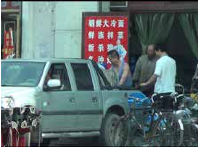
图39:收货的餐馆“群众砂锅狗肉鲜” 图40:皮卡车正在往餐厅卸货

至此我们看到了一条完整的产业链条：收狗人从非正规的活体动物交易市集收购来源不明、健康状况堪忧的犬只，再送到屠宰场进行屠宰加工，加工后直接送到餐馆进入消费环节。整个过程中完全没有检疫或监督部门参与监督任何一个环节。